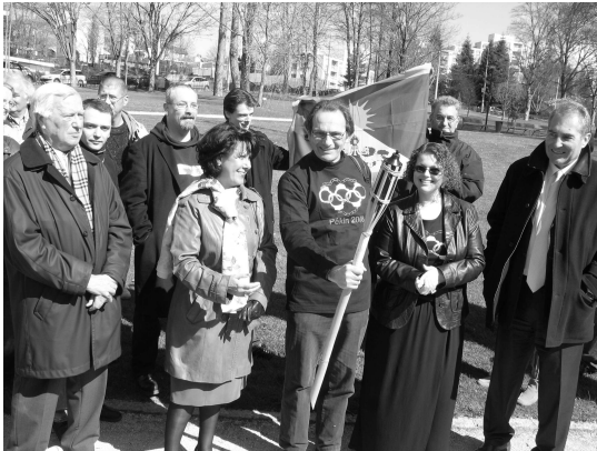
Citoyens et élus symboliquement rassemblés au parc Victor Tuillat ce matin là

Au mois d'août, les Jeux Olympiques se dérouleront à Pékin. Si la candidature de la capitale chinoise avait été présentée comme un moyen de faire avancer les droits de l'homme dans ce pays. Force est de constater qu'aujourd'hui d'éventuelles avancées ne sont pas perceptibles.